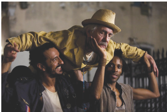
Cena do filme Quincas Berro D'água (2010)

Seus companheiros querem ficar com ele até o fim e, sem saberem, ajudam-no na realização da sua vontade de desaparecer no mar. Já no final do livro, retiram-no do velório e, indiferentes ao rito fúnebre, o levam para passear, conduzindo Quincas, um morto ainda embriagado de vida, para uma última farra.