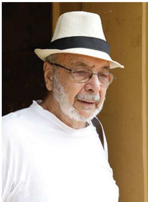
O cineasta baiano Geraldo Sarno

Algumas conversas nunca terminam. Algumas conversas se estendem em atos, são mundos crescentes numa constelação vária que se perde e se acha a cada instante, feito templo de chamas erigido da memória. Algumas conversas simplesmente ficam, nesse eterno ritornelo que une, a cada momento vivido, o velho e o novo, repetição e diferença. Foi com esse entendimento com que me deparei há cerca de quatro anos, quando, por ocasião de uma entrevista, tive a oportunidade de encontrar o cineasta Geraldo Sarno.