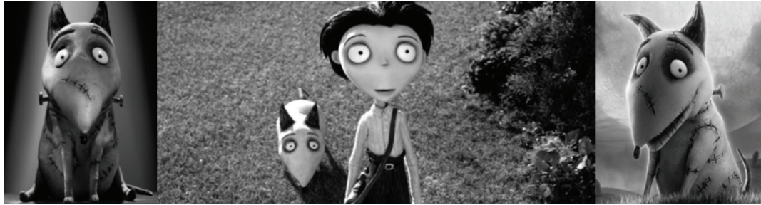
Figura 6: Imagens de Frankenweenie (2012), dirigido por Tim Burton

Vencedor do Oscar de melhor animação em 2016, o longa-metragem de animação Divertida Mente (2015), produzida pelos estúdios Disney e Pixar e dirigido por Pete Docter e Ronnie del Carmen, é, possivelmente, a obra em animação que mais se aproxima das relações com o tema em voga, pois nele a memória é a protagonista. De uma forma completamente lúdica, tenta explicar os pormenores do nosso “centro de controle”, mostrando como somos levados pelas emoções, como guardamos as boas memórias pelo resto da vida, lembrando mais ou menos de algumas, e como preferimos esquecer as partes ruins da vida.