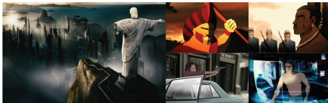
Figura 1: Imagens de Uma história de amor e fúria (2013), dirigido por Luiz Bolognesi

Em um segundo momento, podemos também considerar a memória como fio condutor de tudo que podemos contemplar através de nossa vivência, podendo sugerir uma categórica asserção do que podemos atribuir em um universo imaginativo, considerando as experiências de nossa infância ou das lembranças mais sutis de nossa existência.