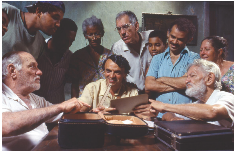
Cena do filme Narradores de Javé (2003), de Eliane Caffé

O filme de Eliane Caffé aborda a história do povoado de Javé, ambientado no sertão baiano. Javé está sob risco de desaparecimento por conta de uma inundação, consequência da construção de uma usina hidrelétrica. Essa situação põe em xeque o povoado. Seus habitantes propõem uma reunião para discutir soluções diante desse acontecimento catastrófico. A partir daí, os moradores de Javé chegam à conclusão de que o ideal seria criarem um documento oficial, relatando todos os grandes acontecimentos da história do povoado, o que acabaria por justificar a importância de sua preservação, dando ao local um caráter de patrimônio histórico que não pode ser esquecido nem perdido no tempo. Para isso, os moradores de Javé compreendem a necessidade de escrever a história do povoado com base nas narrativas orais dos próprios moradores, contando as lembranças que permeiam o processo de estruturação e fundação da comunidade.