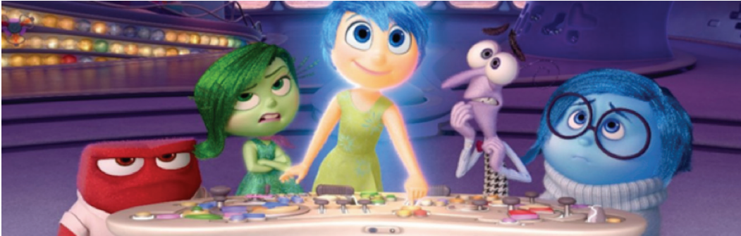
Figura 7: Imagem de Divertida Mente (2015), dirigido por Pete Docter e Ronnie Del Carmen

As memórias atravessam a animação e se tornam a essência dessas realizações fílmicas, poderia dizer até que é a matéria-prima delas – uma matéria da qual nenhum outro tipo de filme é feito com tanta propriedade. Seu corpo é constituído de traços, cores, texturas, exatamente expressas pelo gesto genuíno da memória do desenhista – principalmente no caso de animações autorais. O movimento dos fotogramas se estabelece dentro de um tempo e a velocidade é milimetricamente definida pelo animador, que, além de conferir movimento às fotografias estáticas, perpetua uma espécie de memória imagética, como um cérebro que nunca se desgasta com o tempo. A imagem animada representa a lembrança do ato de existir e, mais ainda, de criar.