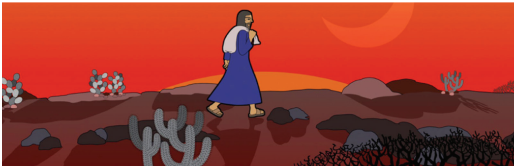
Figura 2: Imagem de Ritos de passagem (2014), dirigido por Chico Liberato

Anima Mundi 7 , afirmou a respeito de sua obra: “O roteiro homenageia dois grandes homens de nossa memória, Lampião e Antônio Conselheiro [...]. Precisa trazer para o povo brasileiro a história do Brasil”. O filme conta com a ajuda das cantigas populares, flora, fauna, costumes, trajes, vocabulário e sotaques da região Nordeste do Brasil para dar vida à história desses míticos personagens. Chico revela que, através das memórias inseridas em seus ritos de passagem – nascimento, batismo, transição da juventude para a idade adulta, morte e transcendência –, os personagens vivem um processo de autoanálise e refletem sobre os acontecimentos que viveram no sertão. Isso demonstra, mais uma vez, a finalidade da obra, pois, conforme explica o autor, “toda minha obra é baseada na cultura sertaneja, cujo objetivo é conscientizar o povo brasileiro” (AUGUSTO, 2012, p. 12).