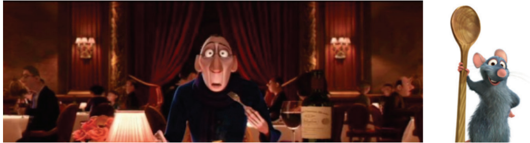
Figura 3: Imagens de Ratatouille (2007), dirigido por Brad Bird e Jan Pinkava

Entre inúmeras animações que têm a memória como mote principal, podemos ainda exemplificar uma que emocionou com sua narrativa simples e feita de lembranças que povoam também o imaginário de centenas de milhares de pessoas: no filme de animação Up - Altas aventuras (2009), de Pete Docter e Bob Peterson, um ranzinza, Carl Fredricksen, de 78 anos, se vê obrigado a sair de sua casa para um albergue de idosos; em meio a esse momento angustiante, ele se depara com seu álbum de recordações, no qual cada foto é uma memória de vivências importantes que vão remontando outras sequências em sua mente. Por meio desse caderno de aventuras, Carl resolve terminar os seus dias envolto nas lembranças de Ellie, sua esposa, e em seu último sonho: mudar-se para o magnífico paraíso das cachoeiras.